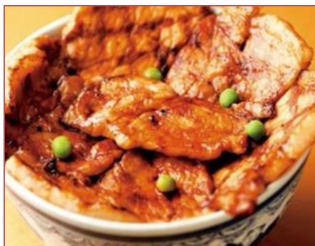
● イメージ写真 ●